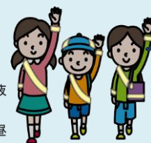
夜光反射材の種類

また、夜間歩くときは、運転者から見えやすいように、 明るい目立つ色の衣服 を着用したり、 靴、衣服、カバン、つえなどに反射材用品等 を付けたりするようにしましょう。