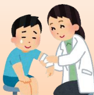
けがによる保健室の利用件数