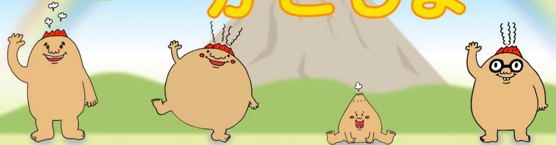
【マグマシティPRキャラクター 火山の妖精マグニョン】